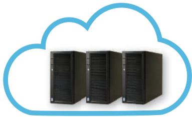
Serveur RISCO Cloud