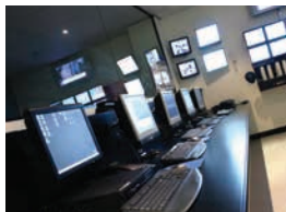
Centre de Télésurveillance